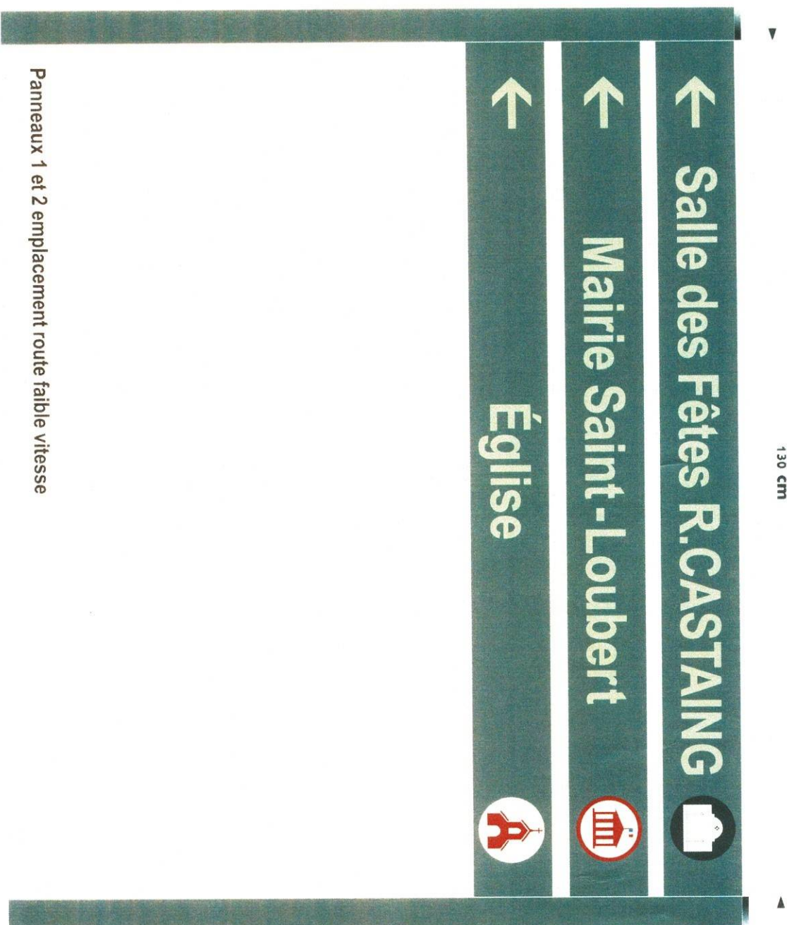
Panneaux 1 et 2 emplacement route faible vitesse