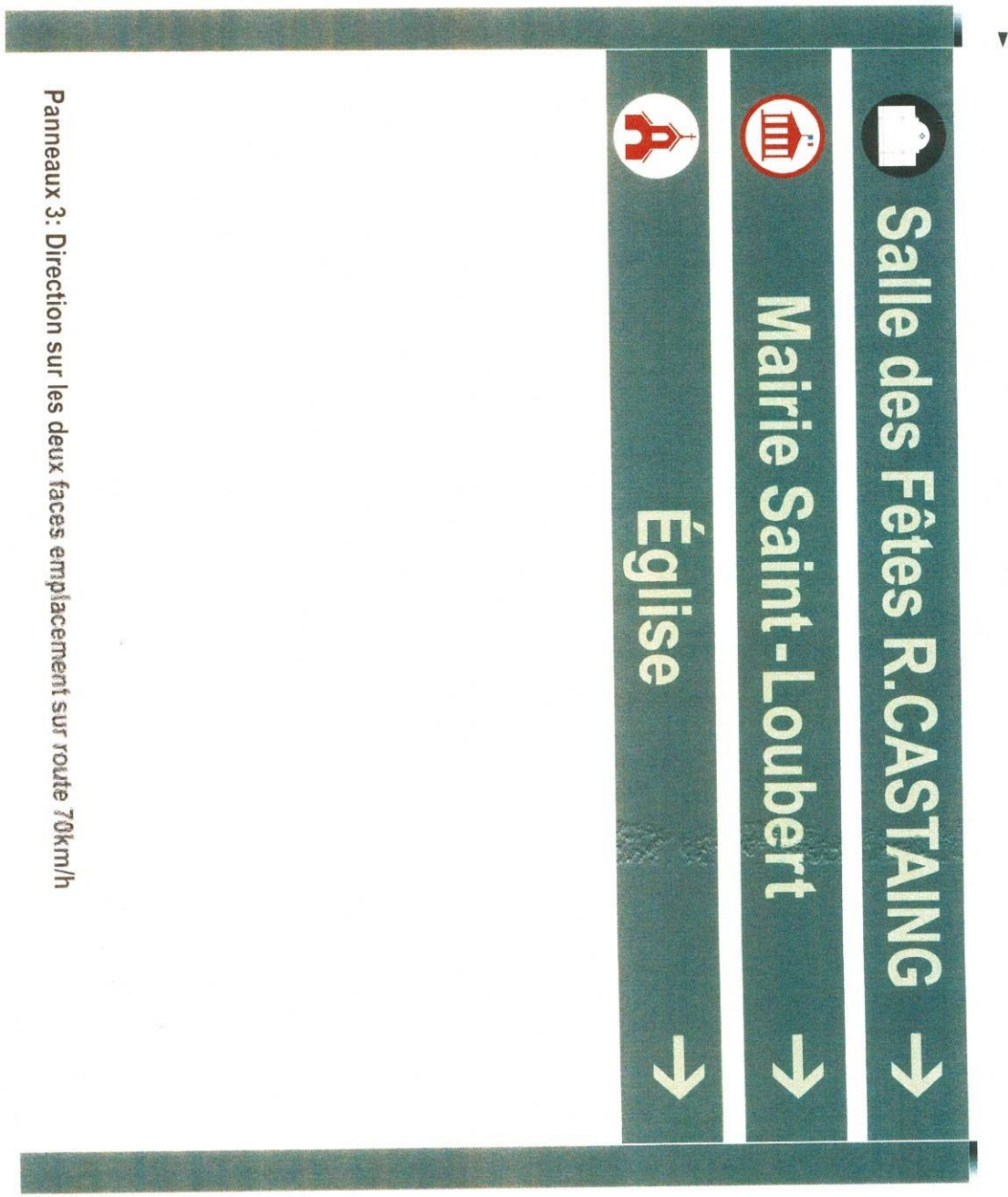
Panneaux 3: Direction sur les deux faces emplacement sur route 70km/h